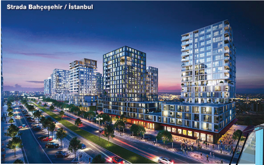
Strada Bahçeşehir / İstanbul