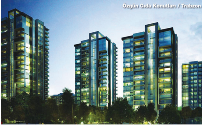
Özgün Gıda Konutları / Trabzon