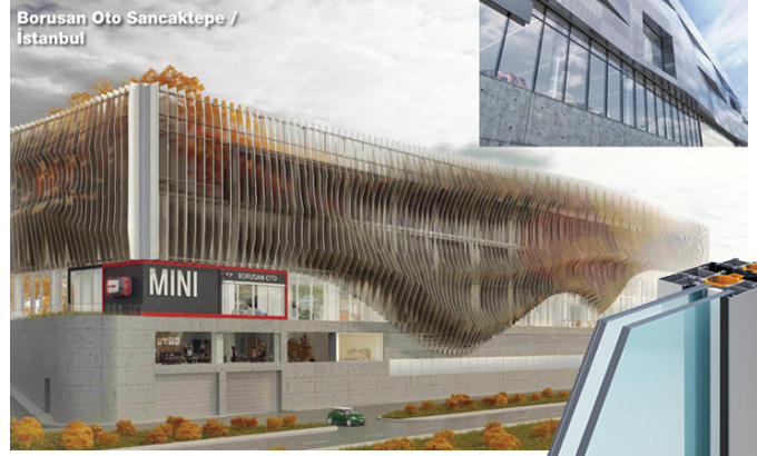
Borusan Oto Sancaktepe / İstanbul